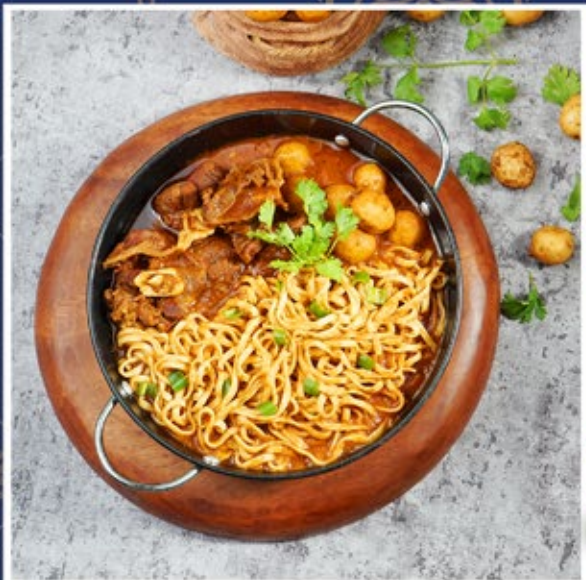
ALOO GOSHT NOODLE