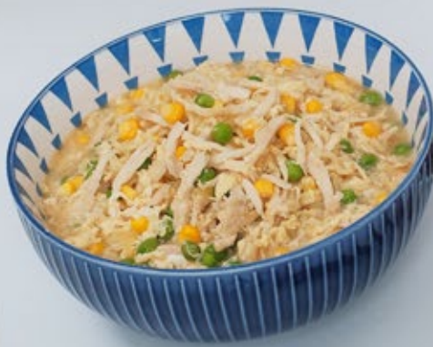
MI KUAH SERABUT TELUR